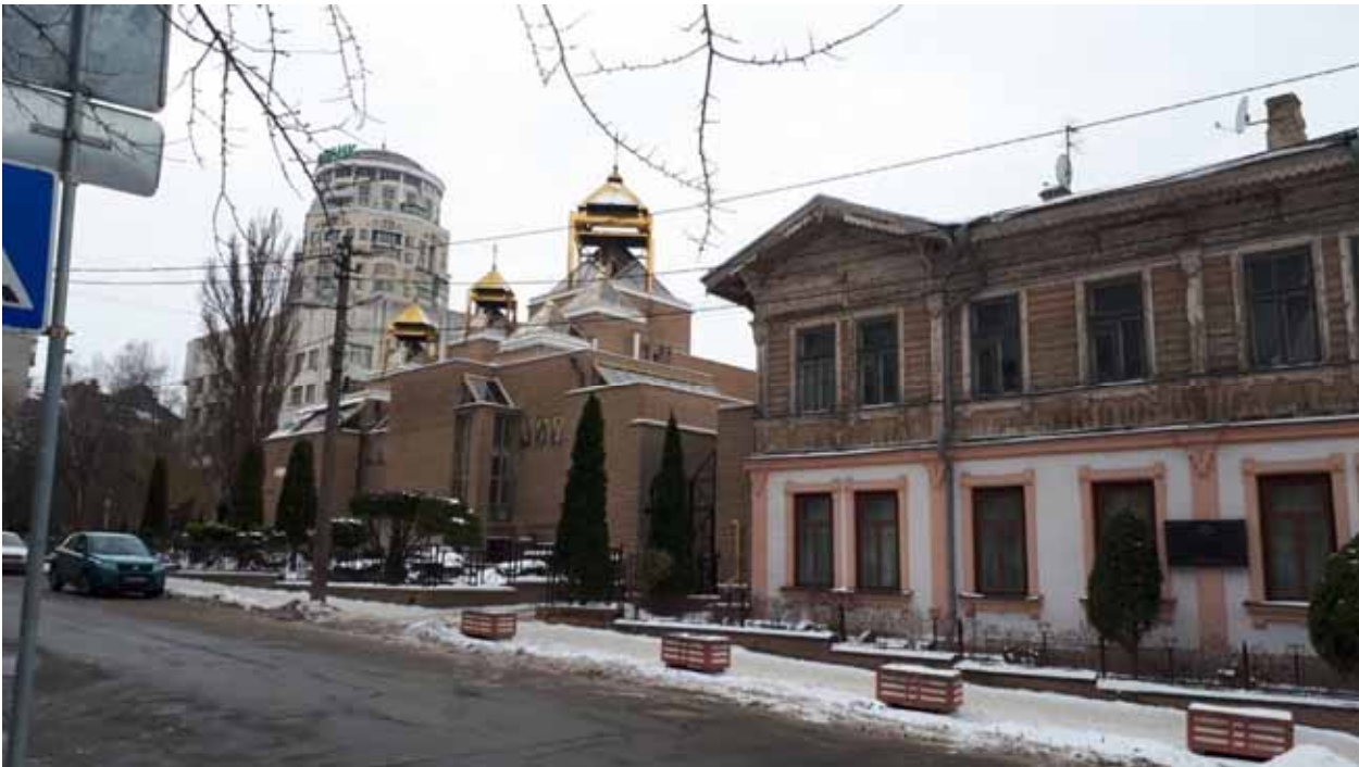
Фото 1. Верхня частина вулиці Вознесенський узвіз. Храм Святого Василя Великого УГКЦ, сучасна споруда, історичний будинок І.Моргилевського.

оперативне освоєння деструктивних, закинутих міських територій, особливо центральних; - розширення та диференціація функцій загальноміського центру; - збереження керованості архітектурно-містобудівним процесом в умовах розмивання можливостей існуючих управлінських і проектних структур.