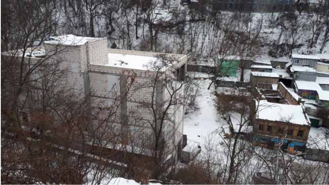
Фото 4. Вулиця Вознесенський Яр. Хаотична забудова, сучасний стан.

документації – «Київпроект», автора усіх 4-х (після 2-ї світової війни) генеральних планів міста, та навіть знесено під нову забудову її цікаву постмодерністську споруду по вулиці Б.Хмельницького,16, збудовану лише 40 років тому. Залишається надія, що згодка та ознайомлення з цією проектно-планувальною роботою надихне і послужить прикладом новим поколінням фахових містобудівників-урбаністів, проєктантів та управлінців – як треба підходити до здійснення у майбутньому подібних завдань та робіт.