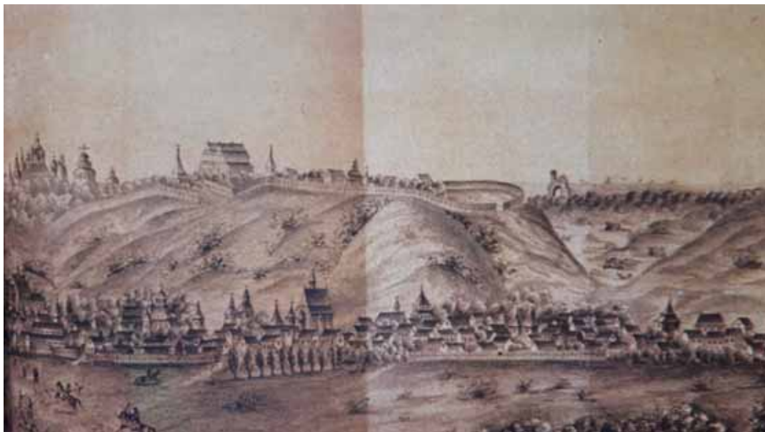
Фото 2. А. ван Вестерфельд. Загальний вигляд Києва з північного сходу. 1651 р. (копія).