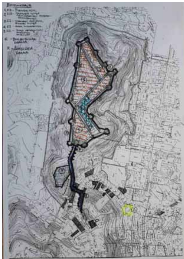
Фото 5. О. Хмель. Ескізна пропозиція ревіталізації території Замкової гори в Києві, схема генплану. 2025 р.

2. Комплексний благоустрій території Замкової гори: -санация зелених насаджень; -благоустрій ділянки, зайнятої залишками цвинтаря (у т.ч. на основі архівних досліджень); -прокладання пішохідних доріжок по встановлених дослідженнями лініям укріплень, інших виявлених споруд (та можливо часткового їх відтворення); -сучасне дизайнерське відтворення силуетів замкових споруд з підсвіткою; -комплексне інженерне обладнання території (електрика, вода, каналізація, в тому числі ливнєва, протизсувні заходи, тощо); -стаціонарне обладнання ділянок археологічних досліджень відповідними спорудами та обладнанням (навіси, доріжки, тощо), з подальшою музеєфікацією їх результатів; -комплексне ландшафтне озеленення території; -влаштування видових майданчиків та громадських просторів, тощо.