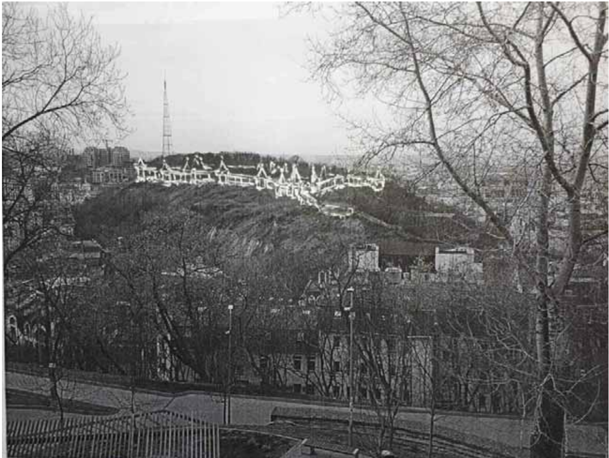
Ескізна пропозиція ревіталізації території Замкової гори в Києві, схема перспективи. 2025 р.