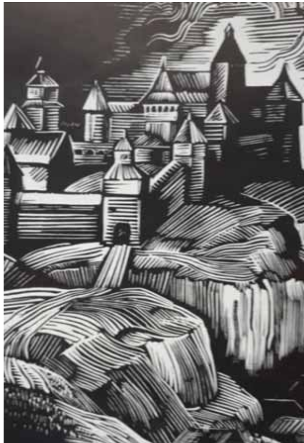
Фото 4. Г. Якутович. Литовський замок у Києві. Ілюстрація до драми І. Кочерги «Свіччине весілля». 1962 р.

Мета статті. Метою даної роботи є дослідження доцільності та необхідності виконання комплексної ревіталізації території Замкової гори в м. Києві для створення громадського простору- «Історико-археологічного парку «Замкова гора».