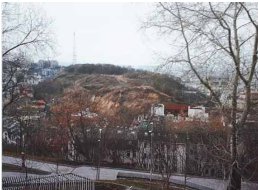
Фото 1. Панорама Замкової гори з півдня. Існуючий стан, 2025 р.

Ключові слова: Замкова гора, історико-культурна спадщина, комплексна ревіталізація території, археологія, міське планування, музеєфікація, комплексний благоустрій, об’єкти необхідної інфраструктури.