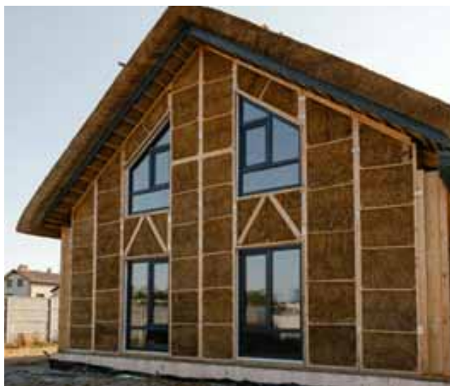
Рис. 2. Будинок компанії Eco Build Ukraine з використанням природних матеріалів. Загальний вигляд. ( https://eco-build.com.ua )