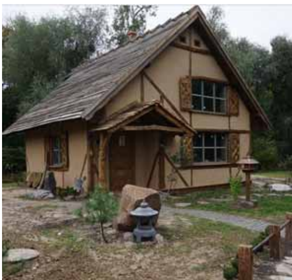
Рис. 1. Будинок з екологічно чистих матеріалів у с. Старе Сумського р-ну. Загальний вигляд.

Несучою основою будинку слугував дерев'яний каркас зі стійок перерізом 100 \times 250 мм, розташованих із кроком 850\text{--}900 мм і з'єднаних горизонтальними в'язями та розкосами. Солом'яні тюки-блоки розміром 400 \times 400 \times 600 мм у конструкції стіни скріплювалися між собою та з елементами каркасу за допомогою загострених дерев'яних прутків з клена чи верболозу. Зовнішнє та внутрішнє опорядження стін виконували так званим фіброглинобетонним розчином, тобто сумішшю місцевої глини й піску з додаванням дрібно посіченої соломи (фібри) та кінського посліду. Співвідношення компонентів глина–пісок–вода підбирали експериментально для кожної партії глини і в середньому воно становило близько 2:1:1,5 .