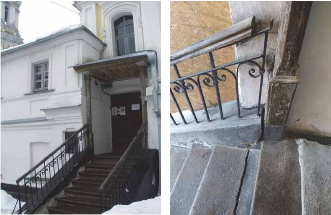
Рис. 5, 6. Стан вхідної групи Троїцької надбрамної церкви до проведення комплексу ремонтно-реставраційних заходів.

Головним архітектором проекту Ю. Лосицьким було ухвалено рішення відновити ганок у тих формах, у яких він дійшов до наших днів. Втім, після виконання натурних досліджень (шурфи) виявилось, що приставні конструкції, так названі парапети, є підсилюючою конструкцією сходів. Вони з'явилися під час повоєнної реставрації пам'ятки – у 1956-62 рр. після демонтажу пізньої дерев'яної прибудови, розміщеної впритул до сходів.