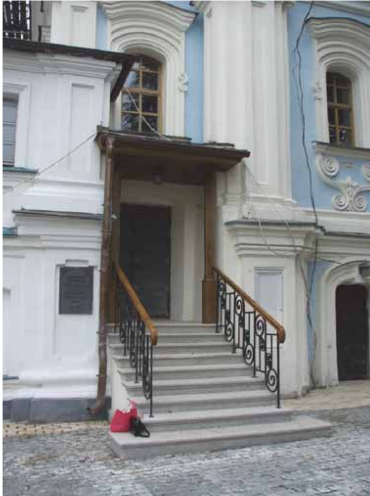
Рис. 7. Загальний вигляд вхідної групи після проведення реставрації. 2024 рік.

раніше. Це рішення дало змогу вирішити давнє питання акумуляції води в куті між сходами і входом до підвальних приміщень церкви зі сторони північного фасаду. Також заміни потребував і стан дерев'яних колон козирка та металеві огорожі сходів. Нові колони було виготовлено у тому ж матеріалі з точним копіюванням форм та деталей. Загалом, після реставрації вхідна група гармонійно доповнила пластику північного фасаду пам'ятки, вписавшись у загальну архітектоніку будівлі (Рис. 7).