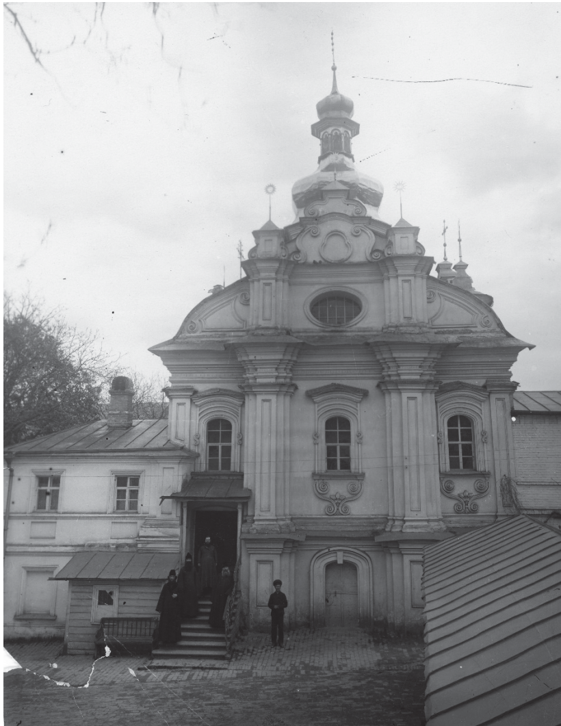
Рис. 4. Північний фасад Троїцької надбрамної церкви. Початок ХХ ст. КПЛ–Ф–952.

У 1951 році з метою підготовки до відновлення пам'ятки були виконані детальні архітектурні обміри Троїцької надбрамної церкви, фотофіксація стану збереження, детальне вивчення форм споруди та особливостей будівельної техніки (Зайцева, 2023, с. 109). Також здійснено демонтаж усіх пізніх прибудов, розміщених із західного та північного фасадів, що спотворювали архітектурний образ пам'ятки. З урахуванням проведених архітектурних досліджень на фасадах Троїцької надбрамної церкви було проведено декілька циклів ремонтно-реставраційних робіт, в рамках яких здійснювались заходи з відновлення вхідної групи пам'ятки, зокрема, укріплення конструкції сходів та заміна елементів огорожі.