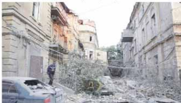
Рис. 3. Пошкоджена пам'ятка разом з фоновіа забудовою в м. Одеса [15, 16, 17]

Поруч з архітектурою минулого при відновленні сьогодні має створюватися якісне просторове оточення, тому гармонійне поєднання історичної та сучасної просторових систем є важливим завданням. При включенні новобудов в середовище, що склалось можемо зазначити тенденції їх створення: – контрастне сполучення нових і старих архітектурних форм; – нюансне (асоціативне) сполучення на основі стилізації; – тотожне сполучення; – точне відтворення усталених історичних форм. Практика повоєнного відновлення Польщі доводить, що нові будівлі утворюють нове середовище – виникають абсолютно нові об'ємно-просторові композиції, масштаби та комбінації фігур, які не були характерні для ансамблів раніше. Так само, віддалення нових будівель від старої червоної лінії забудови викликає пропорції, які створюють нову атмосферу. Відбувається зміщення просторових акцентів – падає роль історичних будівель, які домінуючи над оточенням, утворювали