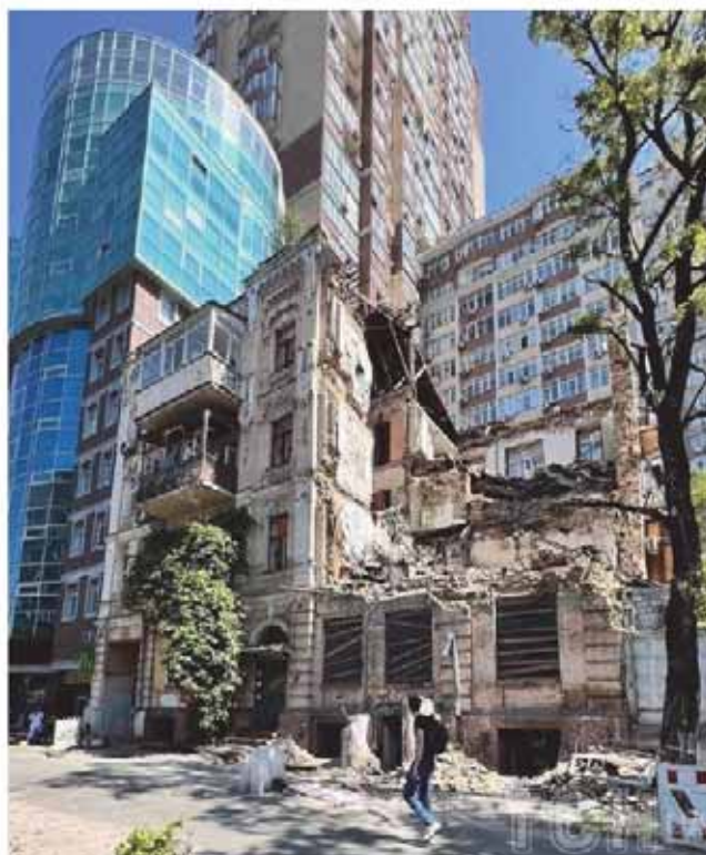
Зруйнований житловий будинок по вул. Жилианській, пам'ятка архітектури