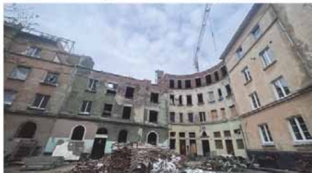
Рис. 2. Реставраційна реконструкція пошкодженої пам'ятки в м. Львів [12, 13, 14]

Однак, реконструйований об'єкт минувшини не може вважатися пам'яткою. Лише оригінальна матеріальна основа пам'ятки, що увібрала досягнення відповідного суспільства і зберегла сліди історичних подій, є документом та джерелом наукової інформації. Для забезпечення об'єктивного підходу до реставрації пам'ятки, максимального збереження її в автентичному стані або визначення найбільш прийнятного методу реставрації, розробка проектно-реставраційної документації здійснюється у декілька стадій: реставраційне завдання, ескізний проект реставрації, робоча проектно-реставраційна документація з реалізацією проекту в натурі. Основною стадією є ескізний проект реставрації, який базується виключно на матеріалах дослідження та їх аналітичному опрацюванні, де у графічній формі висвітлюється методика реставрації пам'ятки; зокрема розкриваються характер та