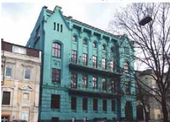
Вигляд пам'ятки до руйнування