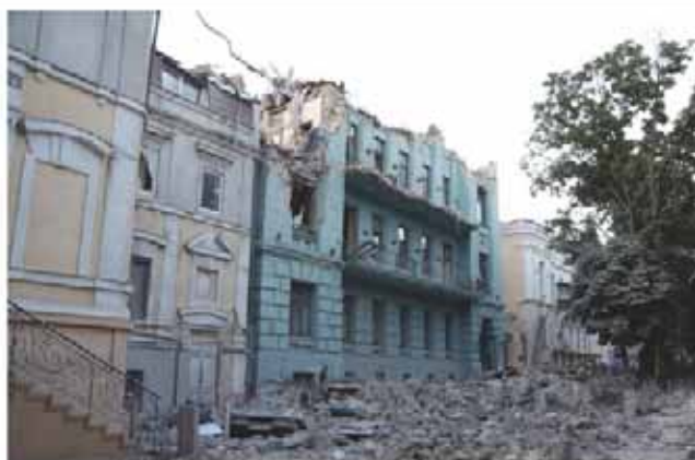
Пошкоджена фоновіа забудова довкола пам'ятки архітектури по вул. Преображенська, 4