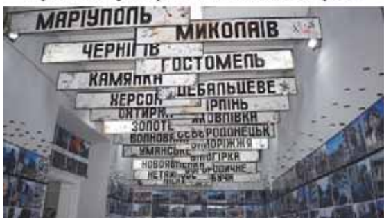
Рис. 1. Можлива музеєфікація зруйнованої пам'ятки – створення меморіалу в м. Київ [10, 11]

Архітектура є відображенням соціальних процесів, носієм соціальної пам'яті. У просторах міст найефективніше здійснюється матеріалізація пам'яті за допомогою монументальних засобів. Відтак необхідно закарбувати «шрами» у просторі міст – місця масових трагедій, де скоєно вбивство мирних громадян, викарбувати у пам'яті людей злочини проти людяності, які ніколи не повинні повторитись у майбутньому [5]. Символічні простори, об'єкти-символи, пам'ятники у міському середовищі поєднуються у контексті нових функцій міст, творять довкілля, несуть історичну пам'ять та стають місцями проявлення сучасних потреб мешканців. Тут можемо говорити про створення меморіалів на місцях вщент зруйнованих історичних будівель, для відновлення яких не вистачає документальних джерел або відбудова яких є недоцільною (рис. 1). Автентичні руїни і фрагменти будівлі з прилеглою територією становлять об'єкт охорони й музеєфікації, оцінюються як документальні свідчення військових злочинів агресора й визнаються меморіальними пам'ятками, що є підставою для їхньої музеєфікації. Дослідниками [4] пропонується визначити такі музейні утворення, як середовищні та надавати їм статус меморіальних. Водночас, на прилеглий до них території можуть бути зведені каплиці, а також, для доповнення меморіальної експозиції, нові сучасні музейні будівлі.