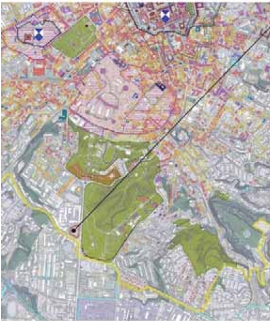
Фрагмент історико-архітектурного опорного плану м. Львів

Реставраційна реконструкція означає відбудову, відтворення, зведення нової споруди на місці і в формах раніше існуючого історичного об'єкта (рис. 2). Реставраційна реконструкція є винятковою дією. Необхідність реставраційної реконструкції втраченого історичного об'єкта визначається його значимістю для національної культури або тим, що він є важливим компонентом композиції містобудівного утворення.