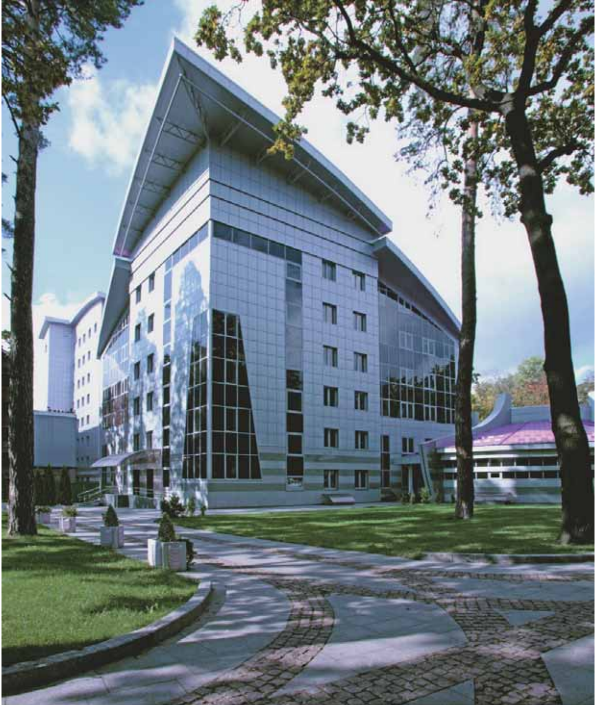
Рис.2. Міжнародний університет "Україна" для мало мобільних груп населення. Київ, вул. Крамського 10. Реконструкція. Проект: 2001–2003, реалізація: 2003–2012.

з них — 29-поверховий галерейний житловий комплекс «Адамант» з майданчиком для гелікоптера та відкритим багаторівневим паркінгом.