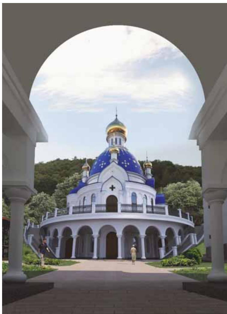
Рис. 4. Спасо-Преображенський храм. Богосо-Глібський жіночий монастир.