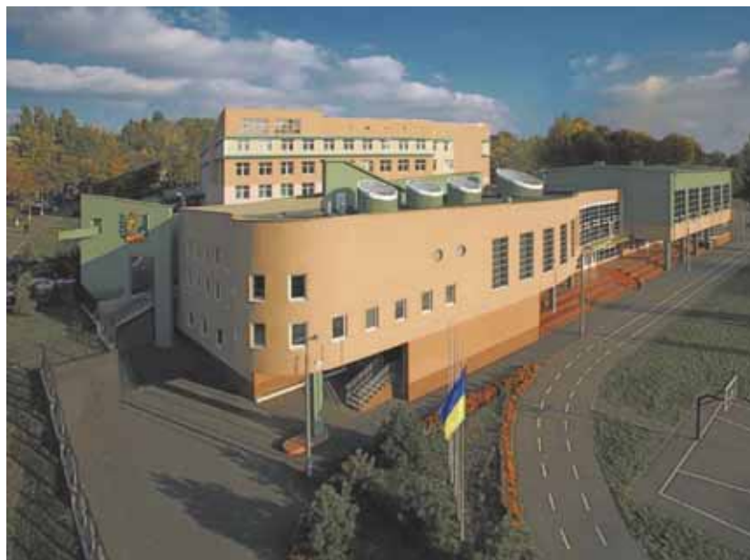
Рис. 3. Гімназія новітніх біотехнологій. Київ, вул. Курська 12. Реконструкція типової школи № 177. Проект: 2004–2005, реалізація: 2005–2006.

і є тією мрією, що далі рухає наш спільний творчий потяг, бо Україна — центр і оплот Православ'я (рис.4-6).