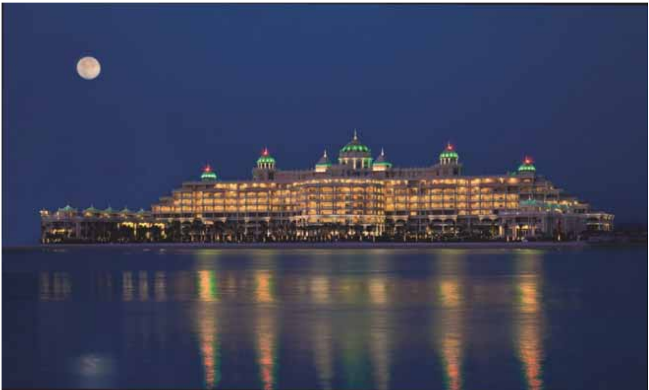
Рис.1. Резиденції KEMPINSKI PALM JUMEIRAH. Дубай, ОАЕ. Проект: 2004–2007, реалізація: 2007–2017.

Завдяки економічного розвитку країни з'явився попит на індивідуальні проекти, які вимагали неабиякого творчого підходу, і абсолютного визнання найвимогливішими зарубіжними експертами. Так, було запроєктовано палац-резиденцію для найбагатшої людини в Україні, і згодом - створено унікальний проект п'ятизіркового комплексу Кемпінські на штучному острові Пальма Джумейра в Дубаї, що вивело нас на міжнародний рівень визнання (рис.1). Стрімко стала зростати географія наших замовлень.