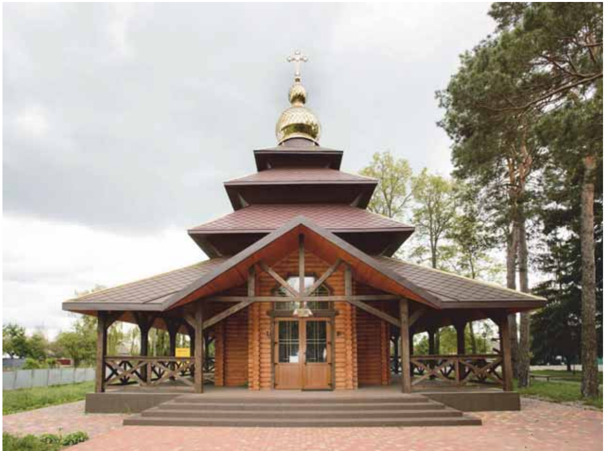
Рис.6. Церква Покрови Божої Матері.