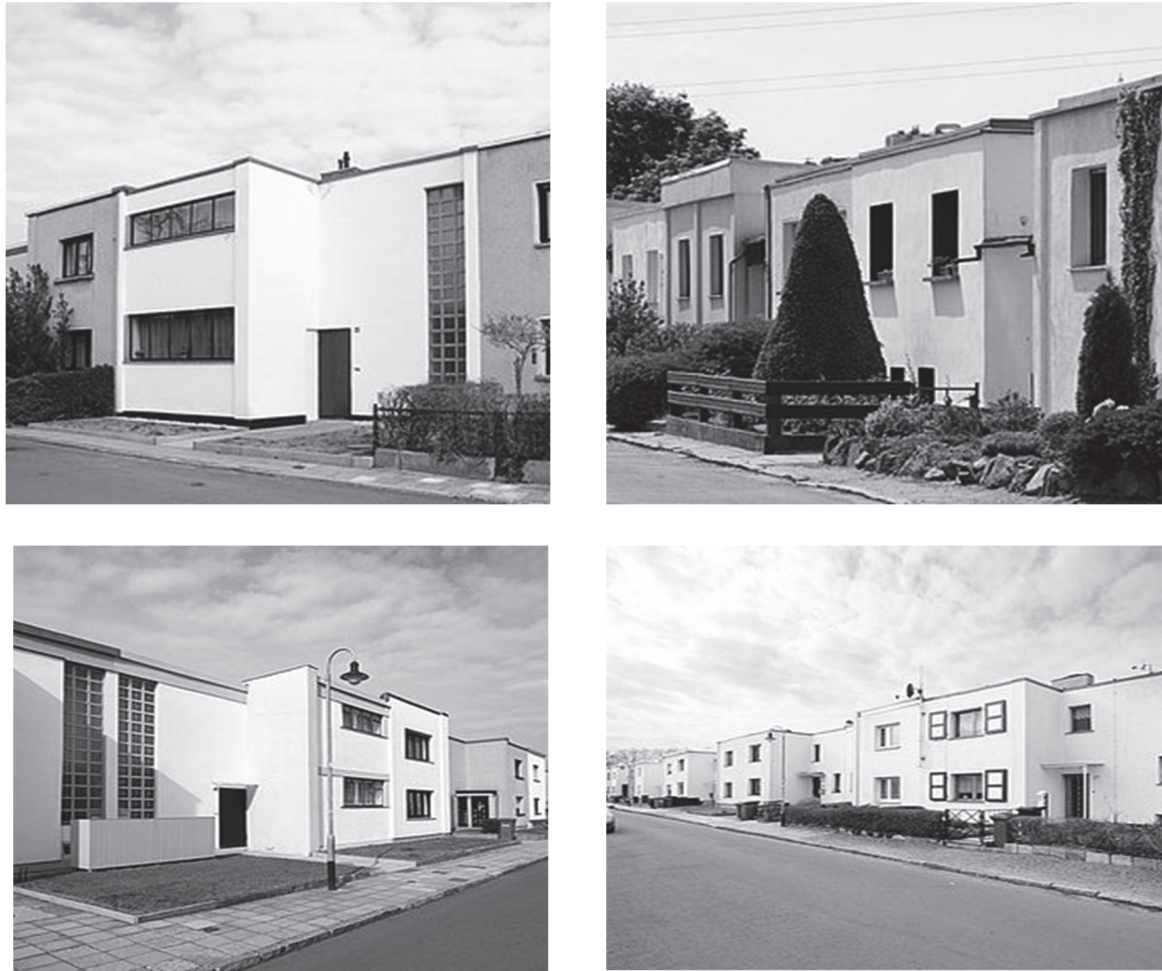
Рис. 4. Селище Дессау-Тертен архітектор Вальтер Гропіус.