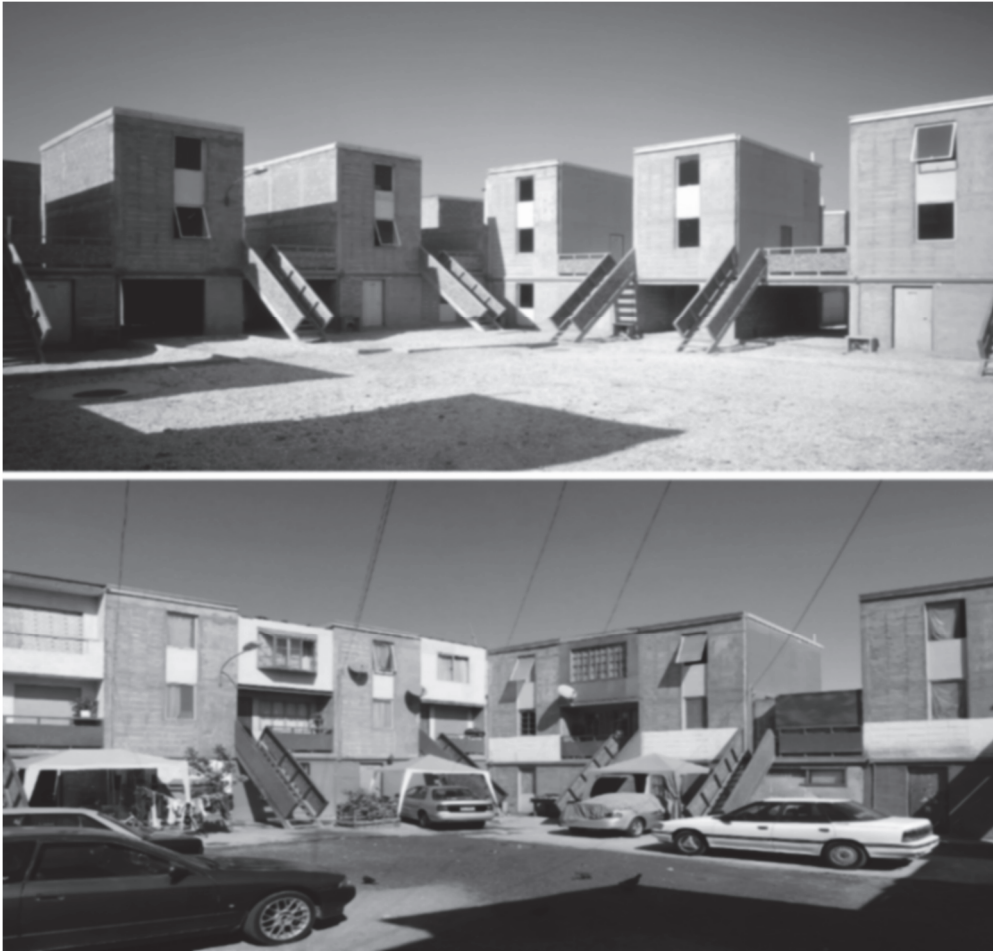
Рис. 1. Квартал Квінта Монрой (Quinta Monroy) в Чилі від Elemental.

В подальшому однорідні одиниці забудови набувають унікальні ознаки, оскільки кожна родина передає свою власну ідентичність структурам.