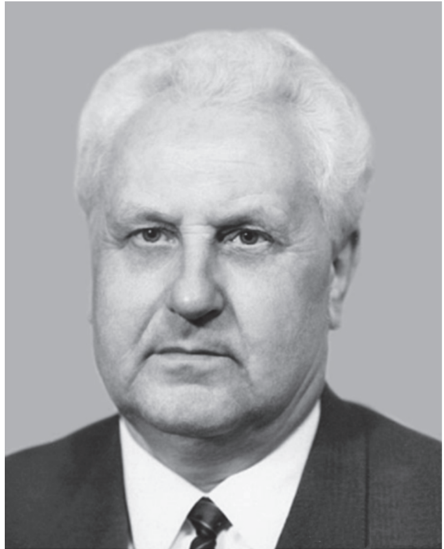
Павло Бакума (1911–1987) — президент Академії будівництва і архітектури УРСР у 1959–1963 роках

Хрущов 1945-го створив Академію, Хрущов встиг її знищити 1963-го: постановою Ради Міністрів СРСР від 6.08.1963 № 853 «Про Академію будівництва і архітектури СРСР і Академію будівництва і архітектури Української РСР» АБіА СРСР та АБіА УРСР ліквідуються, їхні інститути, реорганізуючись, постановою від 21.08.1963 № 903 з єзуїтською назвою «Про поліпшення проєктної справи в галузі цивільного будівництва, розпланування й забудови міст» передаються до різних союзних і республіканських відомств. Так, наприклад, на базі НДІ експериментального проєктування та НДІ архітектури споруд АБіА УРСР виник КиївЗНІЕП Держкомітету з цивільного будівництва Держбуду СРСР, що існує і діє досі.