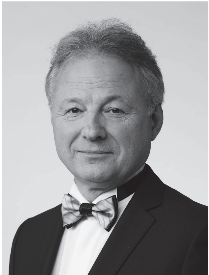
Олег Слепов (н. 1958) — президент Української академії архітектури з вересня 2021 року

Від того часу діяльність Академії поступово згорталася з причин і суспільно-політичної апатії, і неможливості здійснювати наукові дослідження за державної фінансової підтримки, займатися гідною видавничою діяльністю; природні кадрові втрати серед академіків і членів-