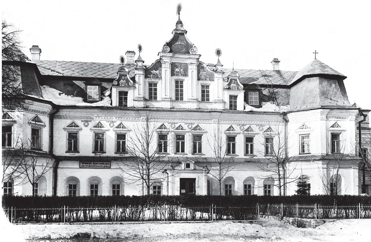
Митрополичий будинок на Софійському подвір'ї, в якому у 1945–1955 роках розташовувалася Академія архітектури Української РСР Київ, 1920-і

Структура АА УРСР була прозорою: Відділенню архітектурних наук підпорядковувалися Інститут будівництва міст, Інститут архітектури споруд, Інститут історії і теорії архітектури та чотири