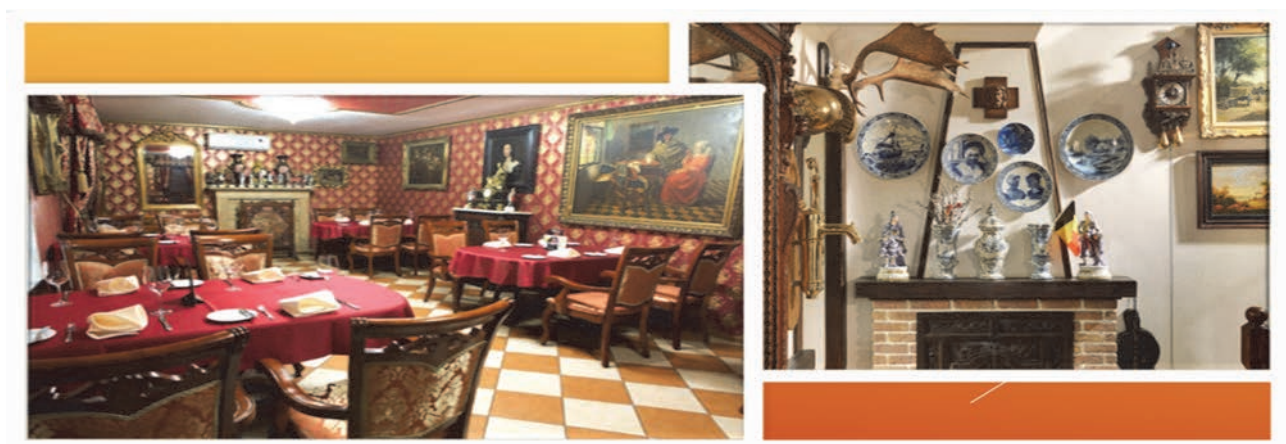
Рис. 5 Інтер'єри ресторану «Antwerpen» у м. Київ

Інтер'єри ресторану Antwerpen в Києві (Рис. 5) не менш багаті на асортимент картин. Вони також оздоблені великою кількістю відомих творів мистецтва та антикваріату. Кольорова палітра залів закладу від теплого жовтого до спокусливого червоного відтворює атмосферу старої Європи та епохи Відродження. У ресторані оформлені Французький, Бельгійський, Німецький і Мисливський зали. Найбільшою гордістю закладу є колекція антикварних творів мистецтва. Бронзові скульптури та картини від французьких, фламандських і німецьких майстрів, які в різні часи створювали свої шедеври в бельгійському Антверпені, обрамлені у вишукані різьблені рами.