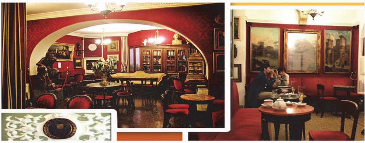
Рис. 3 Інтер'єри ресторану «Antico Caffè Greco» в Римі.

Сучасні тенденції використання картин та скульптур у колірному рішенні інтер'єрів закладів харчування можна простежити у Antico Caffè Greco в Римі (Рис.3). Antico Caffè Greco - це найстаріша кав'ярня в місті і одна з найстаріших в Європі. Тут творили Байрон і Гете, Бізе і Стендаль, Россіні, Тютчев, Гоголь та інші. Стіни в залах закладу прикрашені немов музейні. На них розміщено понад триста художніх творів, а меблі у стилі ренесанс та галерея з автографами знаменитих діячів завершують довершену композицію інтер'єру. Вишуканість та автентичність цього закладу підкреслюють соковиті червоні та жовті кольори в поєднанні із меблями виконами з дорогоцінних порід дерев, що додає особливого шарму.