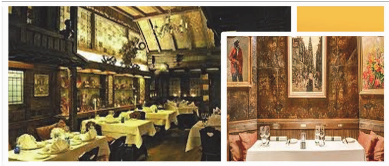
Рис. 4 Інтер'єри ресторану «D' Vijff Vlieghen» в Амстердамі

Колоритність цього ресторану підкреслюють колекції старих рецептних книг, посуд XVII століття, оригінальні офорти Рембранта. Справжня дельфійська плитка, балки та аркові структури у витончено підібраних природніх відтінках у поєднанні з текстурою матеріалів та сонячно-жовтих кольорів – усе це створює атмосферу справжнього старого Амстердама.