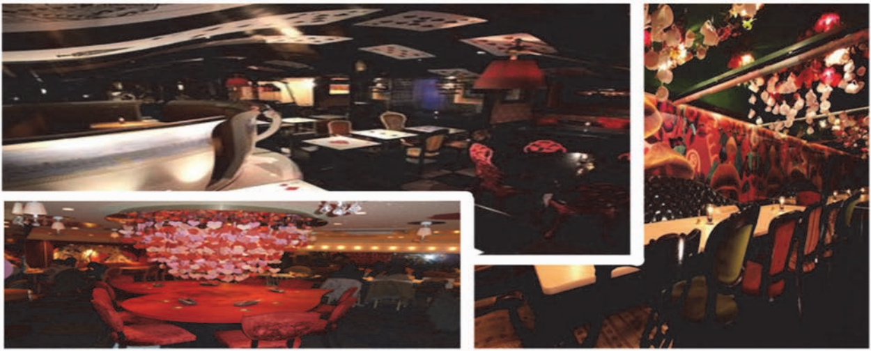
Рис. 9 Інтер'єри ресторану «Alice In A Labyrinth» в Токіо

Інопланетний бар Hr Giger Museum (рис. 10) виник під впливом науково-фантастичного фільму «Чужий». Скульптури ресторану розроблені до найменших деталей, стіни та всі меблі у приміщенні нагадують кістки та скелети. Бар розташований у замку Сен-Жермен, у центрі середньовічного міста Грюер. Він містить найбільшу колекцію творів Г. Гігера: картини, скульптури, меблі, набори фільмів. Між реальністю та вигадкою, минулим і майбутнім, HR Giger бере вас у подорож у захоплюючий світ вашої уяви. У заклалі переважають білі, сірі молочні і злегка жовтуваті відтінки, які в такому поєднанні максимально нагадують палітру відтінків справжніх кісток.