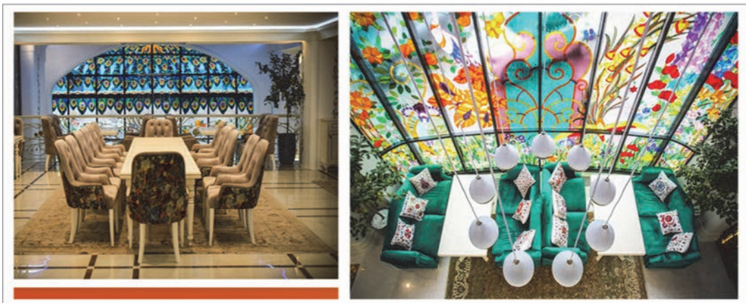
Рис. 7 Інтер'єри ресторану «Shah-Plov» м. Київ

Вітражі надають неймовірної краси інтер'єру ресторану Shah-Plov (рис.7) отримав відчуття особливої вишуканості. Приємні ніжні кольори в поєднанні із апетитними помаранчевим, жовтим і червоним створюють атмосферу затишку, і зупиняють час. Вишуканий інтер'єр прикрашено розкішною люстрою, мармуровими сходами, вишуканим білим роялем. Підлогу покрито килимом із плитки, а захоплюючі візерунки на підлозі гармонійно підтримують скляні вітражі. Стіни ресторану прикрашають більше двох десятків картин. На другому поверсі розмістилося величезне монументальне полотно.