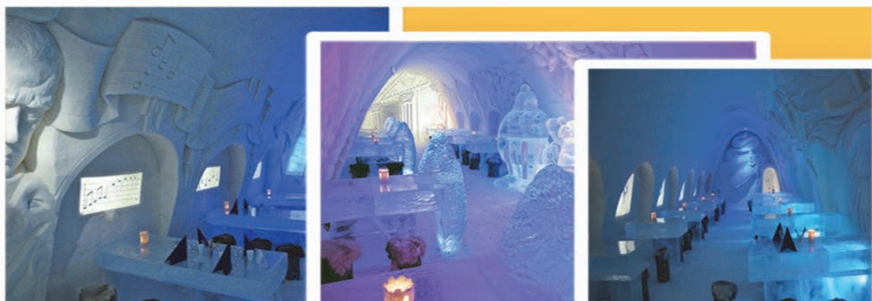
Рис. 12 Інтер'єри ресторану «Snow Castle Restaurant» у Кемі, Фінляндія.

В інтер'єрі ресторану Snow Castle Restaurant (рис.12) застосовано саме водну тенденцію (аква-дизайн), хоча вода перебуває в замороженому стані. Результатом такого сміливого задуму став унікальний ресторан зі снігу та льоду, який щорічно відбудовується заново в кінці січня. Інтер'єр ресторану прикрашений льодяними скульптурами різьбою по стінах та шкурами. Використання кольорового світла, яким підсвідують лід, створює незвичайне враження, для його підсилення найчастіше використовують підсвітку білого та синього кольорів.