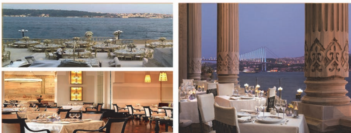
Рис. 1 Інтер'єри ресторану «Tugra Restaurant & Lounge» у Стамбулі.

Яскравим прикладом використання творів образотворчого мистецтва в колірному вирішенні інтер'єру закладу харчування виступає ресторан Tugra & Lounge (Рис. 1) Це - єдиний ресторан-палац у Стамбулі. Інтер'єр закладу виконаний у відтінках кольору слонової кістки, а гра зі світлом та акценти на дрібні елементи декору в яскраво жовтих кольорах створюють особливо романтичну атмосферу. Інтер'єр прикрашений рельєфами та різьбою в турецькому національному стилі, а також картинами та антикварними меблями. Конструктивні елементи інтер'єру закладу є твором образотворчого мистецтва. Вони прикрашені ручним різьбленням та виявленою текстурою матеріалів. У дизайні інтер'єру Tugra Restaurant & Lounge архітектор скористався тенденцією поєднання внутрішніх просторів із навколишнім середовищем, вдало використовуючи пейзаж міста на фоні розкішної річки. Конструктивні елементи інтер'єру закладу є твором образотворчого мистецтва. Вони прикрашені ручним різьбленням та виявленою текстурою матеріалів.