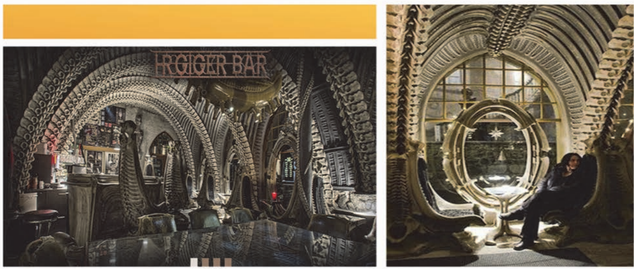
Рис. 10 Інтер'єри ресторану «Hr Giger Museum» у Грюєрі

Інопланетний бар Hr Giger Museum (рис. 10) виник під впливом науково-фантастичного фільму «Чужий». Скульптури ресторану розроблені до найменших деталей, стіни та всі меблі у приміщенні нагадують кістки та скелети. Бар розташований у замку Сен-Жермен, у центрі середньовічного міста Грюер. Він містить найбільшу колекцію творів Г. Гігера: картини, скульптури, меблі, набори фільмів. Між реальністю та вигадкою, минулим і майбутнім, HR Giger бере вас у подорож у захоплюючий світ вашої уяви. У заклалі переважають білі, сірі молочні і злегка жовтуваті відтінки, які в такому поєднанні максимально нагадують палітру відтінків справжніх кісток.