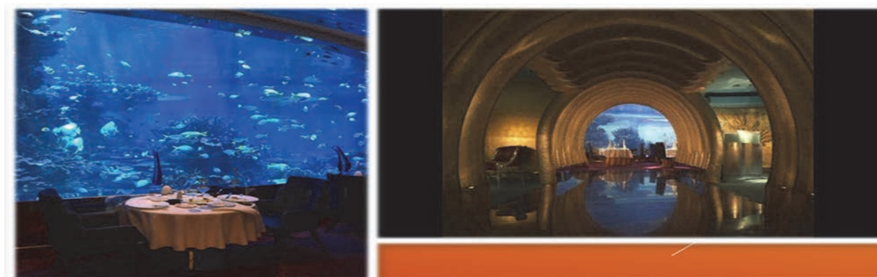
Рис. 11 Інтер'єри ресторану «Al Mahara» Дубай, ОАЕ.

переливами водного оточення підкреслюють морський колорит закладу та його оригінальність.