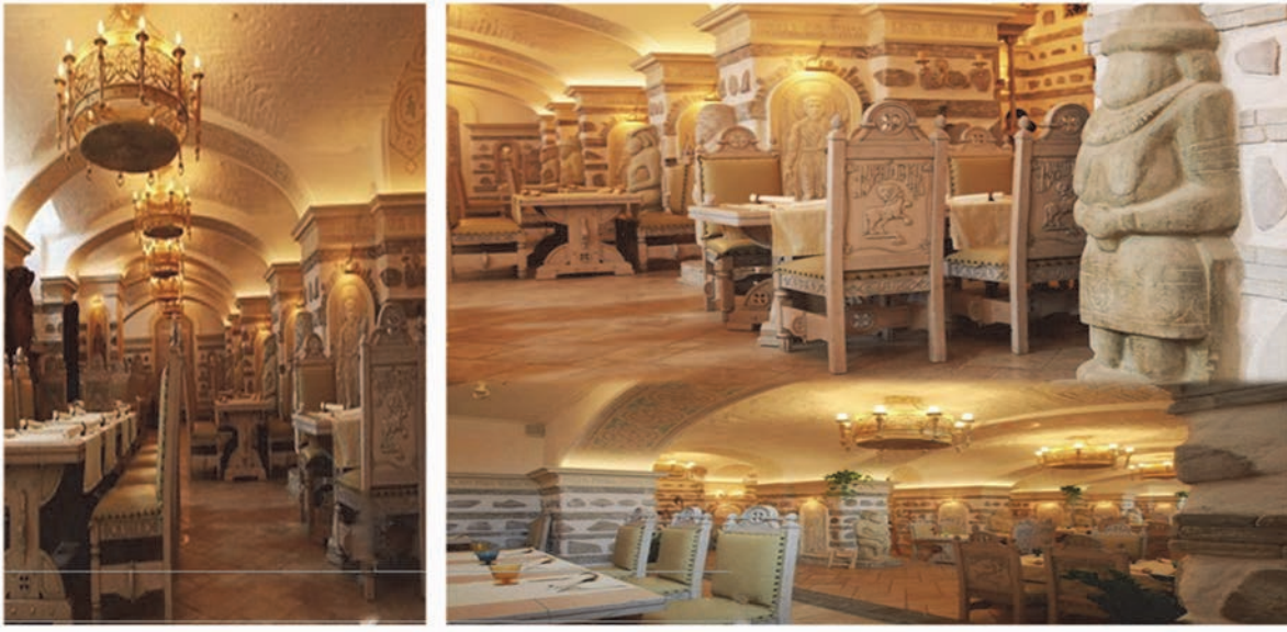
Рис. 2 Інтер'єри ресторану «Княжий град» у Києві.

Сучасні тенденції використання картин та скульптур у колірному рішенні інтер'єрів закладів харчування можна простежити у Antico Caffè Greco в Римі (Рис.3). Antico Caffè Greco - це найстаріша кав'ярня в місті і одна з найстаріших в Європі. Тут творили Байрон і Гете, Бізе і Стендаль, Россіні, Тютчев, Гоголь та інші. Стіни в залах закладу прикрашені немов музейні. На них розміщено понад триста художніх творів, а меблі у стилі ренесанс та галерея з автографами знаменитих діячів завершують довершену композицію інтер'єру. Вишуканість та автентичність цього закладу підкреслюють соковиті червоні та жовті кольори в поєднанні із меблями виконами з дорогоцінних порід дерев, що додає особливого шарму.