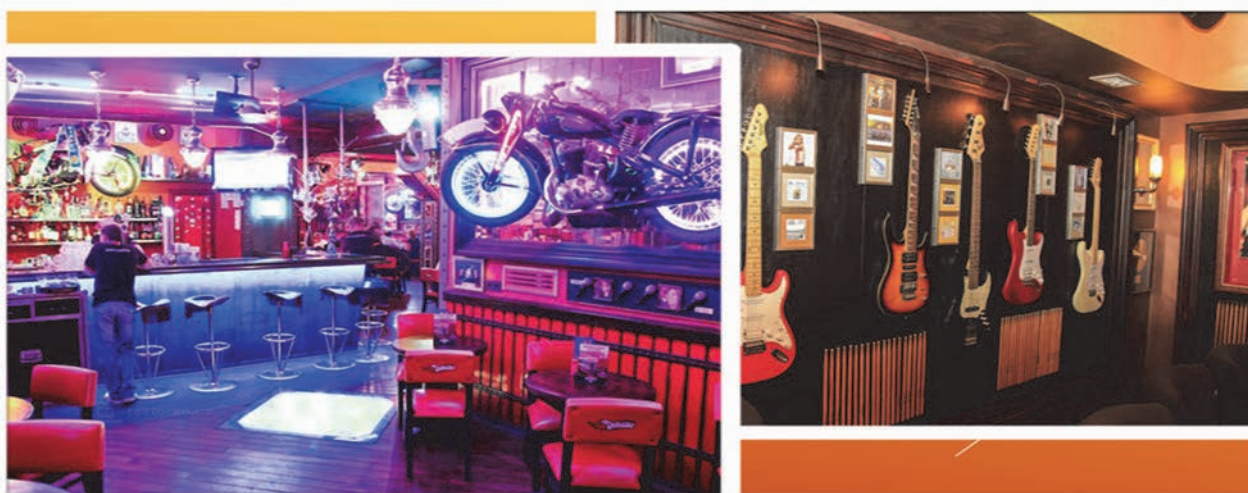
Рис. 8 Інтер'єри ресторану «Дежавю» у Києві

Сьогодні в створенні сучасного інтер'єру закладу харчування часто застосовують тенденцію використання провідної тематики закладу. Яскравим прикладом є ресторан Дежавю, у Києві (рис. 8). Тут зібрані автографи музичних зірок усього світу. Багато раритетних речей, якими облаштоване кафе було викуплено на різноманітних міжнародних аукціонах, серед них концертна гітара гурту «Metallica», ексклюзивний шарф Патріції Каас, золоті диски легендарних «Led Zeppelin» і «Deep Purple» – це гордість колекції бару. Саме ці елементи інтер'єру, а також і байки якими прикрашено стіни закладу, це твори мистецтва. В інтер'єрі ресторану активно використані чорний, червоний, фіолетовий, кольори природних відтінків дерева в поєднанні із жовтими та помаранчевими кольорами.