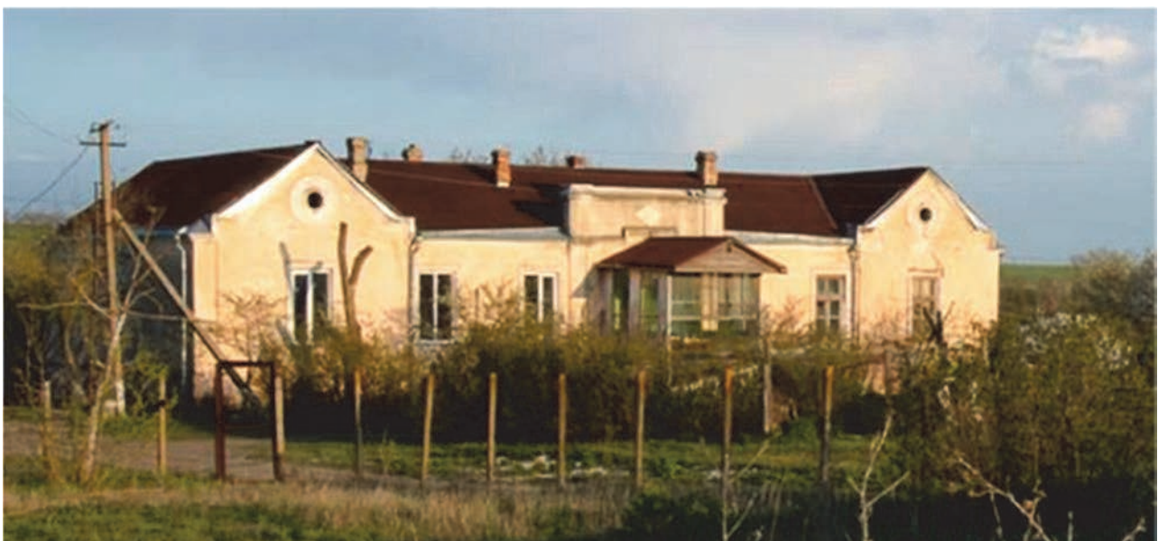
Рис. 5. Усадьба Кузнецова в селе Степановка Лиманского района Одесской области.