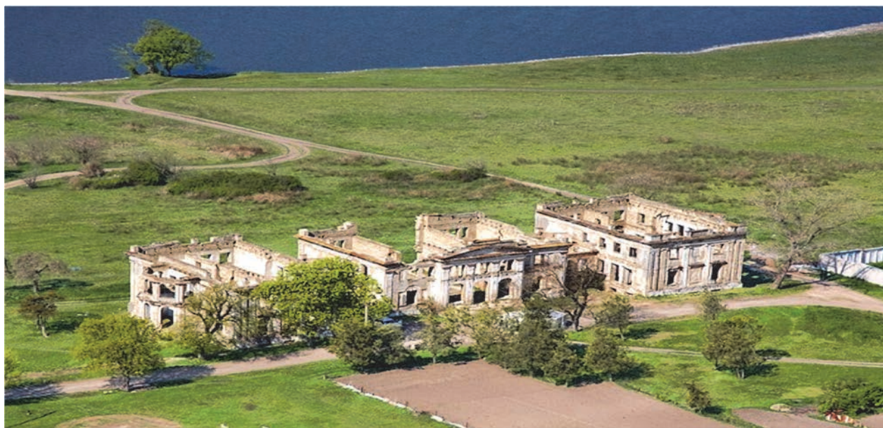
Рис. 4. Усадьба Дубецких-Панкеевых в селе Васильевка Беляевского района Одесской области.