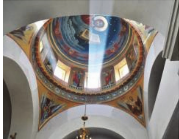
Рис. 4 Сучасний стан Свято-Троїцької церкви в Приморську

Під час громадянської війни нащадки В. В. Орлова-Денисова виявилися по різні боки лінії фронту. Одні з них підтримали білогвардійський рух, і після змушені були емігрувати. Інші воювали за нову владу, деякі з них стали відомими людьми за радянських часів [10].