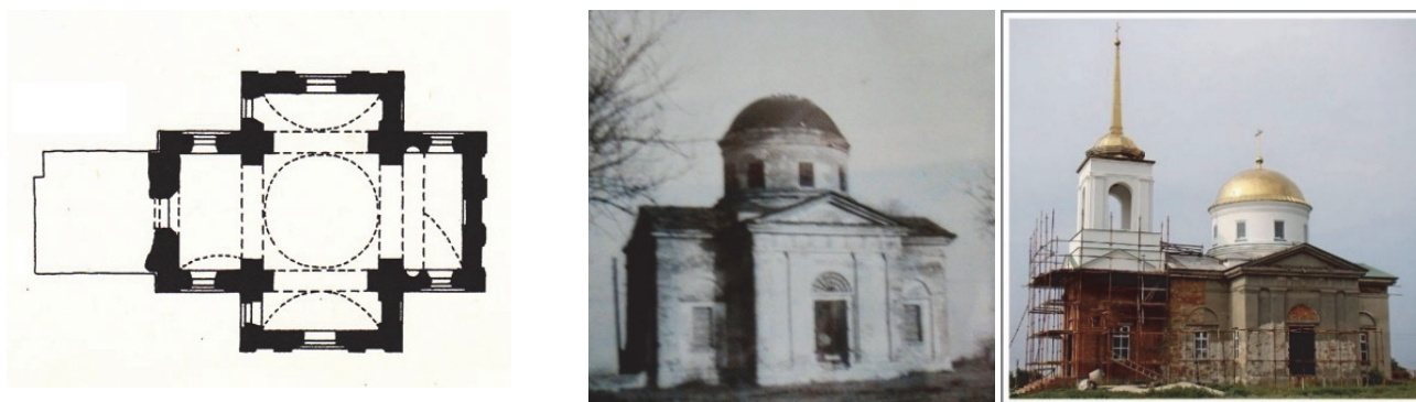
Рис. 1. План і південний фасад Троїцької церкви в Обіточному до і під час реставрації

Початковий план церкви Святої Трійці в Обіточному має компактне рішення у вигляді малого, майже рівнокінцевого хреста. Купол спирається на досить потужні пілони, утворені перетином поздовжніх і поперечних стін. Вівтарна частина прямокутного контуру майже рівновелика притвору. Виступаючі на фасадах прямокутні пілястри під трикутними фронтонами, що утворюють своєрідний плоский портик, додають вигляду храму властиві класицизму строгість і вишуканість.