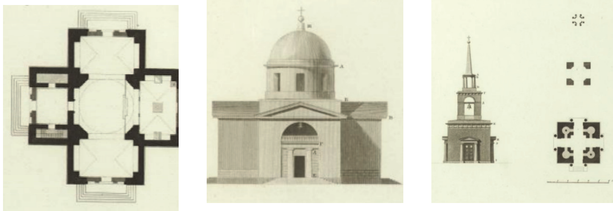
Рис. 2. План, фасад і дзвіниця з альбому зразковихцерков 1824 року

Реставрація храму почалася в 1980-их роках. В ході будівельних робіт була відновлена дзвіниця, оновлені покриття, стіни поштукатурені і пофарбовані білою фарбою. При внутрішній обробці церкви вдалося відновити 8 з 12 стінних фрескових розписів ХІХ ст., виявлених під шаром побілки. Реставрація велася за спонсорської підтримки підприємства «Мотор Січ».